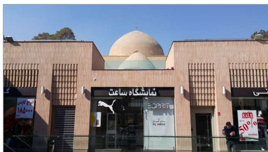
هماهنگی با محوریت تاریخی

در شیوه تجزیه و تحلیل موارد پرسش‌نامه، از ضریب هم‌بستگی پیرسون ۱ در نرم‌افزار SPSS استفاده شده است. در بررسی هم‌بستگی دو متغیر، اگر هر دو متغیر مورد مطالعه در مقیاس نسبی باشند، از ضریب هم‌بستگی گشتاوری پیرسون استفاده می‌شود. مقدار این ضریب، میزان هم‌بستگی دو متغیر بین +۱ و -۱ است. اگر مقدار به دست آمده مثبت باشد، به معنی این است که تغییرات دو متغیر به طور هم‌جهت اتفاق می‌افتند؛ یعنی با افزایش در هر متغیر، متغیر دیگر نیز افزایش می‌یابد