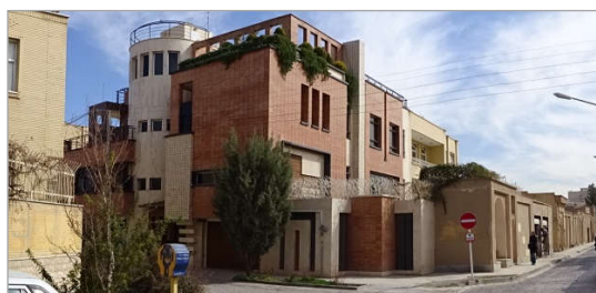
هماهنگی با محوریت نوآوری

تصویر ۲. تصاویر مربوط به جلفا با بیشترین امتیاز از رویکردهای چهارگانه (نگارنده)