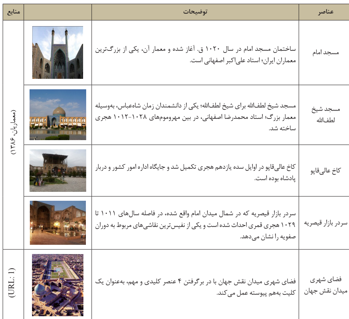
جدول ۲. عناصر میدان نقش جهان

جدول ۷، نشان‌دهنده بررسی ماتریس وزنی زیرمعیارهای ارزش اجتماعی-فرهنگی است. به لحاظ ارزش نمادین، مسجد امام، بالاترین امتیاز را به خود گرفته است. فضای میدان نقش جهان به لحاظ ارزش‌های تفریحی، هویت، تداوم خاطرات جمعی و وحدت در عین تنوع، بالاترین امتیازها را گرفته است. این نشان می‌دهد که تقریباً به لحاظ ارزش اجتماعی-فرهنگی، فضای شهری میدان نقش جهان در مجموع از وزن بیشتری برخوردار است. ماتریس وزنی زیرمعیارهای ارزش احساسی در ارتباط با ۵ مؤلفه مورد بررسی، در جدول ۸ نشان داده شده است. با توجه به این جدول مشخص شد که به لحاظ ارزش مذهبی، مسجد