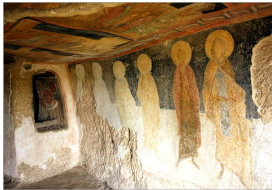
تصویر ۶. دیوارنگاره‌های موجود در یکی از دخمه‌های دره رودخانه روسنسکی (http://whc.unesco.org/en/list/45/gallery/)

برای انسجام بخشی مطالب این بخش، مواردی که در پرونده‌های ثبت جهانی آثار خارج از ایران به عنوان شاخصه‌های ارزشی دیوارنگاره‌ها یادشده، در جدول ۲ بطور خلاصه ارائه شده‌است.