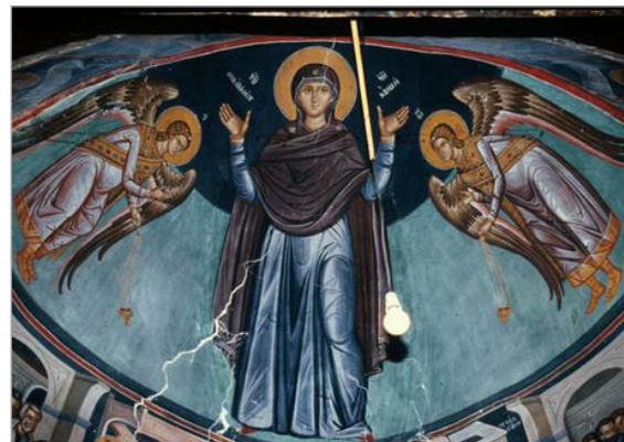
تصویر ۵. نمونه‌هایی از دیوارنگاره‌های موجود در فضای داخلی کلیساهای منطقه تردوس