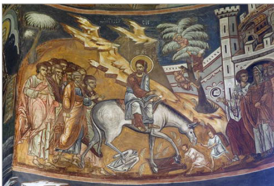
تصویر ۳. بخشی از دیوارنگاره‌های موجود در فضای داخلی کلیسای سنت جورج صومعه Voronet سابق (http://whc.unesco.org/en/list/598/gallery/).

در دره رودخانه روسنسکی ۴۳ در شمال شرق بلغارستان نیز، مجموعه‌ای از کلیساها به شکل دخمه‌های کنده‌شده کوچک، صومعه‌ها و سلول‌های توسعه‌یافته در مجاورت روستای ایوانوو ۴۴ وجود دارد. اینجا نخستین محلی است که اولین زاهدان گوشه‌نشین، سلول‌ها و کلیساهای خود را طی قرن دوازدهم میلادی در آنجا حفر کردند. نقاشی‌های دیواری