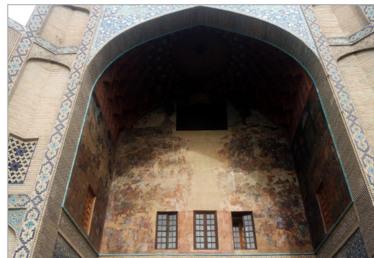
تصویر ۸. نقاشی‌های تمپرای سردر قیصریه با موضوع حمله ازبک‌ها، قرار گرفته در ضلع شمالی میدان نقش جهان اصفهان.