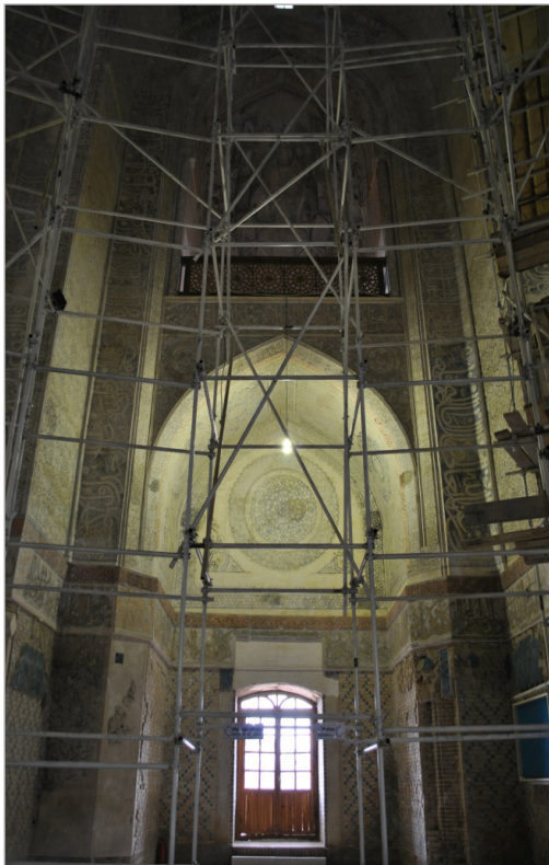
تصویر ۱۲. فضای داخلی عمارت سلطانیه که سراسر با عناصر تزئینی آذین شده است (نگارندگان).

۳. از منظر تاریخ آفرینش اثر، دارای طول عمر قابل توجهی باشد؛ آنچه ویژگی حاضر را از مورد قبلی متمایز می‌سازد، این است که طول عمر به تاریخ تولد دیوارنگاره نظر داشته و نه به اثرات متقابل زمان و دیوارنگاره در طی سالیانی که از زندگی اثر می‌گذرد. ریشه طرز فکر قدمت ارزش بیشتر را بایستی در نهاد انسان و شکل رابطه او با زمان دانست. شاید بتوان ادعا کرد، از آنجاکه بشر نتوانسته بر زمان تسلط یابد و آن را در کنترل خود