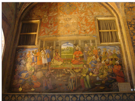
تصویر ۱۰. بخشی از دیوارنگاره‌های یادمانی و پرشمار صفوی در کاخ چهلستون.