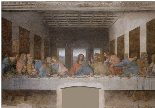
تصویر ۷. نقاشی شام آخر، ۱۴۹۸-۱۴۹۵، تمپرا و تکنیک‌های مختلف بر اندود. ۴۶۰ × ۸۸۰ سانتی‌متر، صومعه سانتا ماریا delle Grazie، میلان

نظر به مطالب بیان شده که به شکل مستند از اسناد ثبتی نمونه‌های اکثر اروپایی آورده شده‌بود، حال بایستی با مراجعه به اسناد ثبتی مربوط به آثاری که از کشور ایران در فهرست میراث جهانی قرار گرفته‌اند، به جایگاه دیوارنگاره‌ها در روند ثبت آنها پی‌برد. بطور کلی می‌توان برآورد کرد که متأسفانه در این اسناد جائیکه بطور شاخص و به گونه‌ای مشخص به دیوارنگاره‌های موجود در برخی از بناهای کشورمان حتی اشاره قابل توجهی شده‌باشد، وجود ندارد. چه در مورد بناهای حاشیه میدان نقش جهان اصفهان، چه باغ‌های ایرانی و چه گنبد سلطانیه. البته درباره گنبد سلطانیه به تزیینات معماری شایان توجه آن اشاره شده‌است که انتظار می‌رفت با وجود شاهکارهای دیوارنگاری قابل توجه موجود، بخشی از معیارها را به این موضوع اختصاص دهند. برای بررسی چنین مدعایی شاید بهترین گزینه، اسناد ثبتی آثار موجود در ایران باشد که از لحاظ وجود آثار دیوارنگاری، غنی و شاخص هستند. در مجموعه میدان نقش جهان، تنها به ویژگی‌های معماری یادمان‌های چهار طرف میدان بدون بیان کردن ویژگی‌های ارزشی دیوارنگاره‌های موجود مانند آثار دیوارنگاری عالی‌قاپو و سردر قیصریه و وجود آثار رضا عباسی در عالی‌قاپو به عنوان نقاش صدرنشین مکتب اصفهان اشاره شده‌است. اگرچه دیوارنگاره سردر قیصریه براساس شاخصه‌های ارزشی مورد توجه جهانی بدون احتساب جنبه‌های ارزشی دیگر، خود به تنهایی از نظر ابعاد شاهکار عظیمی است و یکی از بزرگ‌ترین نقاشی‌های تمپرای ۲۶ خاورمیانه به شمار می‌رود و از نظر تکنیک هم، یک اثر منحصر به فرد مکتب اصفهان است (تصویر ۸). در مجموعه باغ‌های ایرانی که همگی با عنوان "باغ ایرانی" در فهرست آثار میراث جهانی ثبت شده‌اند، کوشک‌ها و