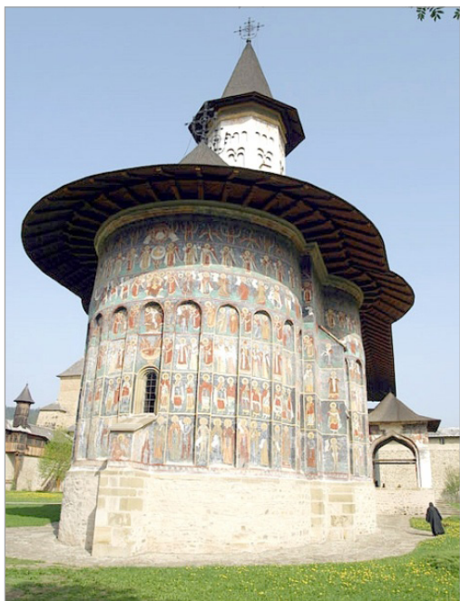
تصویر ۱. فضای بیرونی کلیسای سنت جورج صومعه Voronet سابق، دیوارنگاره‌های موجود در آن شاخص‌ترین عنصر مرکز توجه در شکل کلی بناست ( http://romaniantouristguide.ro ).

در اسناد مرکز تاریخی شهر بروژ ۲۱ در بلژیک نیز یکی از معیارهای مشخص برای ثبت آن اثر، وجود دیوارنگاره‌هایی بوده‌است که سبب‌شده به عنوان زادگاه اولیه مکتب نقاشی دیواری فلاندرز و مرکزی برای حمایت و توسعه نقاشی در قرون وسطی به حساب آید. هنرمندانی چون جان ون آیک و هانس مملینگ از هنرمندان این مکتب بوده‌اند که به دیوارنگاره‌های موجود در این منطقه ارزش و اهمیت بخشیده‌اند ( whc.unesco.org/en/list/996/documents/ ). بدیهی است در چنین موردی دیوارنگاره‌ها افزون بر ارزش قدمتی که دارند به