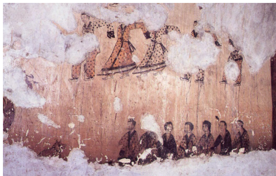
تصویر ۴. نمونه‌هایی از دیوارنگاره‌های موجود در مقابر پادشاهی کایپورو