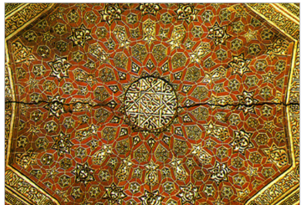
تصویر ۱۱. نمونه‌ای از عناصر تزئینی بنای سلطانیه.