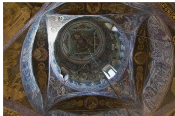
تصویر ۲. دیوارنگاره‌های موجود در فضای داخلی کلیسای سنت جورج صومعه Voronet سابق (http://whc.unesco.org/en/list/598/gallery/).