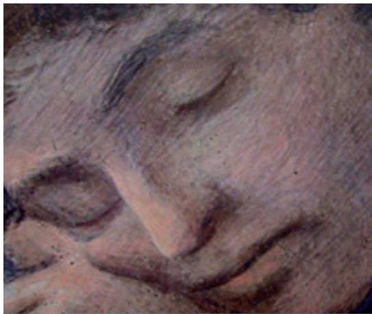
تصویر ۴. خطوط هاشورمانند روی نقاشی‌های ایتالیایی (Baldini, 1990)

فن به‌گونه یک پرده روشن‌تر از رنگ‌های مجاور، برای جلوگیری از اغفال و تداخل با کار اولیه، بهترین است» (Ruhemann, 1968: 52-68). در هر دو مورد، رنگ‌ها به‌گونه یک پرده روشن‌تر و سردتر از رنگ اصلی به کار می‌رود. اما روهمن به شیوه اجرایی پردازش اشاره کرده است که گرچه در این مورد شیوه موفق‌ست، اما در اینجا به دلیل استفاده از تفاوت بافت نیاز به رنگ روشن‌تر نیست و در صورت کاربرد آن می‌توان در پایان از لعاب آبرنگی روی کار بهره گرفت. در مواقعی که کمبودهای فرسودگی طبیعی، وسیع‌تر از نقاط ریز کوچک باشند، می‌توان زمینه‌ی کمبود را با لعاب آبرنگی در طرح موردنظر رنگ کرد. «طرز کار در شیوه نقطه چین رنگ، مشابه روش هاشورزی عمودی [که در ادامه خواهد آمد] است که در آن، نقاط به طور کامل هم پوشان نمی‌شوند تا چشم بتواند رنگ‌ها را در هم آمیزد.» (Mittone, 2010). «در رویکرد نظام مند مرمت، همان‌گونه که لورا و پائولو مورا مشخص کردند، ابتدا موزون‌سازی کمبودهای کوچک و سپس بازسازی قطعات بزرگتر انجام می‌شود» (Lignelli, 2002: 183-188). پس از ناکامی روش رنگ خنثی، درباره کمبودهایی که به لحاظ محدودیت ابعاد، قابلیت بازسازی دارند، «برندی در مرکز رم، در همکاری با پائولو مورا، مشهورترین فن مشهود در موزون‌سازی را به‌عنوان Rigatino یا هاشورزی عمودی، [در فاصله سال-های ۱۹۴۵-۵۰م] توسعه داد.» (Caple, 2000: 119-136) «این در واقع گونه‌ای مرمت تصویری است که از فاصله نزدیک قابل تشخیص است و شامل کاربرد عمودی خطوط رنگی یک سانتی متری برای انطباق آنها با ناحیه تصویری مجاور است (تصویر ۳)» (Ciatti, 2002: 191-206). ابداع‌کنندگان این روش اشاره می‌کنند که هاشورها