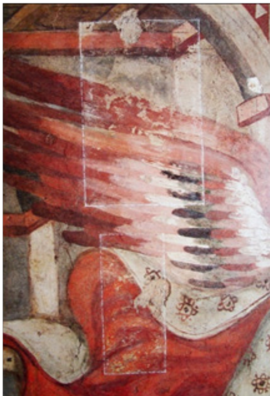
تصویر ۲. موزون‌سازی از طریق لعاب آبرنگی، نواحی داخل خط چین وضعیت قبل از مرمت می‌باشند (Mora, Mora, and Philippot 1983)

به گفته برندی روش رنگ خنثی، اولین تلاش برای انسجام بخشی به تصویر بود که می‌خواست از روش‌های مبتنی بر تصور و خیال بپرهیزد. این تلاش صادقانه بود، ولی کافی نبود، چرا که؛ مشخص شد هر رنگی، خنثی یا غیر خنثی، بر ترکیب رنگی نقاشی تأثیر می‌گذارد، و در عمل، هیچ رنگ خنثایی وجود ندارد (برندی، ۱۳۸۶: ۵۲).