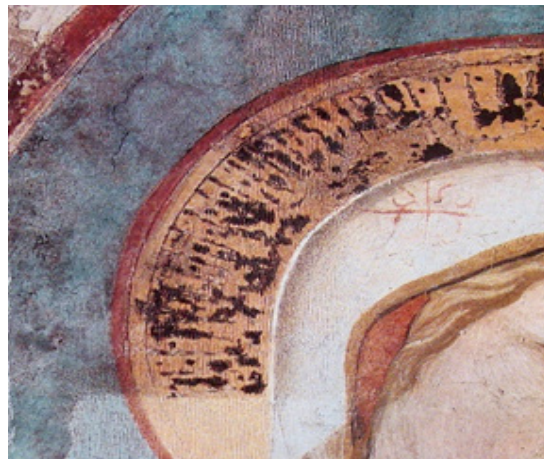
تصویر ۳. رتوش به روش هاشورزی عمودی (Mora, Mora, and Philippot, 1983)