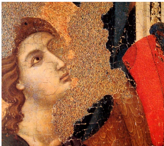
تصویر ۶. رتوش به روش هاشور آزاد چندرنگ در بخش سمت چپ و هاشور آزاد تک رنگ در بخش قرمز سمت راست (Rothe 2001)

مشخص شود نقاشی‌ها به طور مستقیم در ضرب‌آهنگ معماری شرکت دارند، می‌توان با تکیه بر مستندسازی مستدل، به بازسازی پرداخت که جزئیات آن ذکر شد، و گرنه یا باید از روش هاشور آزاد چند رنگ کمک گرفت، یا اگر سطح کمبود بسیار وسیع است، از بازسازی اندود در سطحی پایین‌تر به کمک پرکننده رنگی یا بتونه ساده و یا دوغاب رنگی یا بدون رنگ، بهره برد. لازم به ذکر است درباره نقاشی‌هایی با رنگ‌های تخت و جسمی نظیر آثار تمپرای ایرانی، می‌توان بجای کاربرد خطوط هاشور که با توجه به خاستگاهشان متناسب با برخی فرسک‌های ایتالیایی ست، به کاربرد رنگ‌ها به گونه یکدست توجه داشت. درباره دیگر آثار دارای سایه روشن، استفاده از هاشور یا پرداز می‌تواند مناسب باشد، که این نیز وابسته به خصوصیات بصری عناصر بکار رفته است. گاه لطافت موضوع و از آن رو نرمش خطوط و حساسیت رنگی، متضاد با به‌کارگیری خطوط عمودی ست و برعکس، گاه استحکام نقوش در به‌کارگیری خطوط مستقیم، همخوان با این سبک موزون سازی ست. آخرین موردی که می‌تواند در صورت لزوم اجرای سریع موزون سازی در محدوده‌های وسیع، مورد آزمون قرار گیرد، پیاده کردن طرح بر پوستر از راه امکانات دیجیتال و نصب در سطح کمی برجسته‌تر از سطح اصلی است که همان ملاحظات اساسی درباره شرایط اولیه انجام رتوش تصویر (استناد به مدارک معتبر و پرداخت بدون جزئیات یا رنگ مایه روشن‌تر) را درگیر می‌کند و تنها تفاوت این است که به صورت موقت و بر سطحی غیر از دیوار انجام می‌شود.