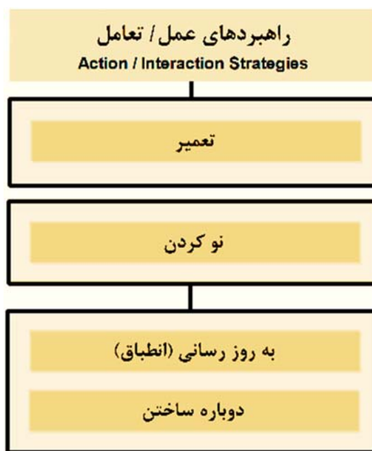
تصویر ۴. راهبردهای عمل-تعامل (نگارندگان)

این درجات مداخله که در موقعیت‌های مختلف استفاده شده‌اند را در نظر داشت. همان‌طور که در تصویر ۴ نیز ارائه شده است، تعمیر، نو ساختن، به‌روز رسانی و دوباره ساختن، مباحثی بوده که به‌عنوان این درجات مد نظر معماران بومی قرار گرفته‌اند ( جدول ۵ ). این راه‌حل‌ها به‌نوعی تمهیدی برای حفظ اصول و باورهایی هستند که تحت عنوان ارزش‌های معماری می‌شناسیم و معماران سنتی تلاش داشته‌اند تا آنها را حفظ کنند. هم‌چنین این موارد دارای سطوح متفاوتی بوده که بسته به شرایط انتخاب می‌شوند و به‌ترتیب با تعمیر، به‌روز رسانی، نو ساختن و در نهایت با دوباره ساختن، مورد توجه معماران بومی قرار گرفته‌اند.