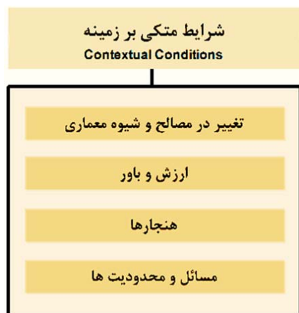
تصویر ۳. شرایط متکی بر زمینه (نگارندگان)

علت‌ها و دلایل مرور شده در بخش ابتدایی در فرآیند اقدام، تحت تأثیر شرایط زمینه‌ای و هم‌چنین شرایط دخیل می‌توانند منجر به فراز و فرودهایی شوند. شرایط زمینه‌ای