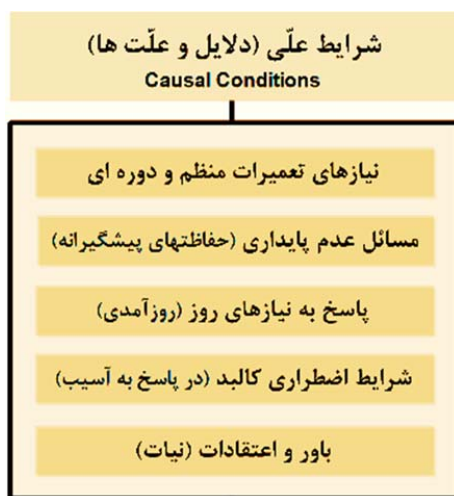
تصویر ۲. شرایط علی (نگارندگان)

تعیین یا تعریف شرایط زمینه‌ای و مؤثر بر اقدامات حفاظتی، مجموعه‌ای از روابط و شرایط حاکم بر آنها را هدف قرار داده است که در کنار شرایط علی - که دلایل و علت‌ها را مرور نمود - شرایط و تأثیرات محیط بر اقدام عملی را مطرح و ارائه می‌نماید. شرایط زمینه‌ای، مجموعه خاصی از شرایط بوده که در یک زمان و مکان خاص جمع آمده تا مجموعه مسائلی را به‌وجود آورند که اشخاص با عمل/ تعامل خود در پی پاسخ به آنها هستند. این شرایط مشخص می‌کنند که چرا پدیده‌ای هم‌چون اقدام حفاظتی در برخی موارد بیشتر