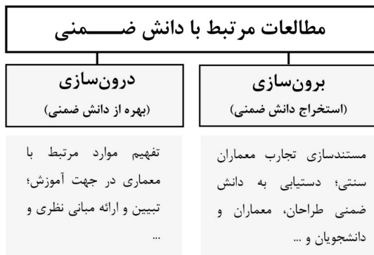
تصویر ۱. مطالعات مرتبط با دانش ضمنی (نگارندگان)

گروه دوم، مطالعاتی است که برای استفاده از دانش ضمنی در جهت تفهیم موارد مرتبط با طراحی معماری (درونی کردن دانش ضمنی) به آن پرداخته‌اند (Andjomshoa et al, 2011)، ولی موضوع حفاظت از معماری کمتر در آنها مورد توجه بوده است. استخراج و تبیین مبانی نظری با بهره‌گیری از این دانش ضمنی برای معماری مثل بهره‌گیری از دانش ضمنی طراحان داخلی و هم‌چنین موضوع ارتباط با مشتری در این